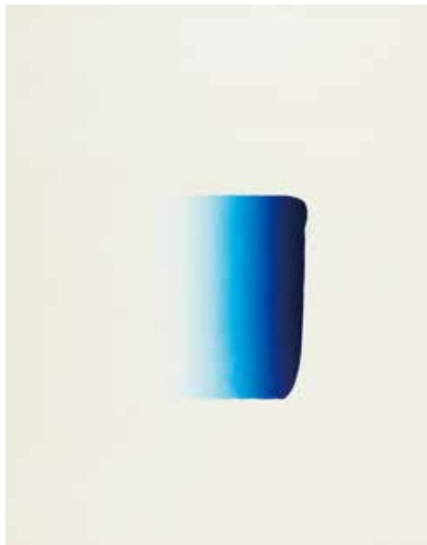
李禹煥《Dialogue 2019 1》 2019年、木版、シロタ画廊蔵 ©LEE Ufan, Courtesy of Shirota Gallery

日本の現代美術を語るうえで常に重要な位置を占める、高松次郎(1936-1998)、若林奮(1936-2003)、李禹煥(1936-)。