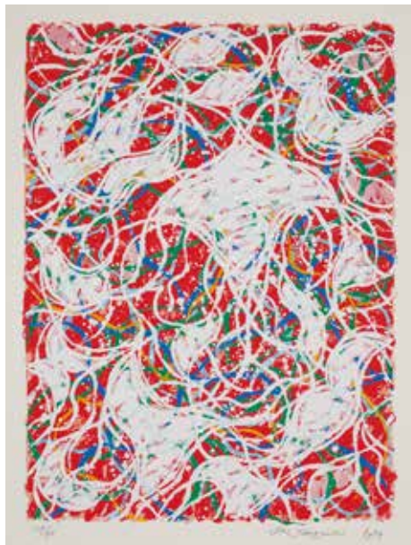
高松次郎《アンドロメダA-1》 1989年、スクリーンプリント、The Estate of Jiro Takamatsu 蔵